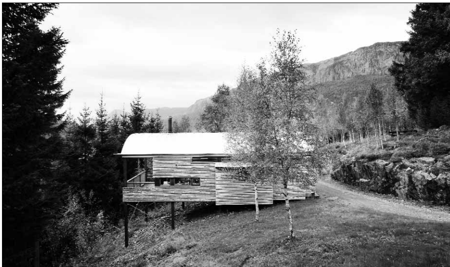
Nordisk kunstnarsenter Dalsåsen.

våningshuset og den nyoppussa Løa, kan òg bli viktige.