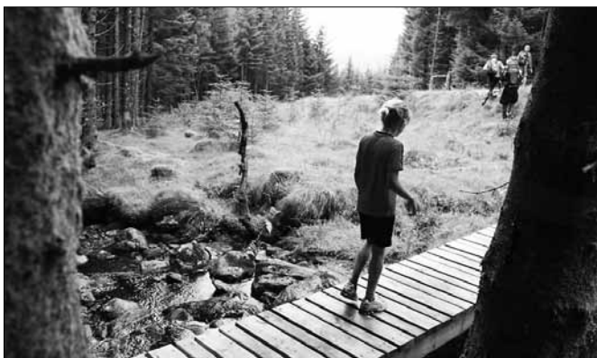
Bru ved Østenstad.