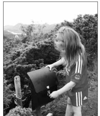
Lone ved postkassa.

I 2012 så står ein turveg langs Dalselva for tur. Ruta startar ved Vesle Daniel-støtta i Dale sentrum, går gjennom Tusenårsstaden/Klokkargarden til Steia, vidare over Jarstadbrua og nordover langs elva til området under Svehogen. Stien held fram langs vegen til Hagehola, bak Elvetun barnehage og vidare langs elva, over brua og tilbake til utgangspunktet ved Vesle Daniel. Dette blir ei løype på ca 3,5 kilometer som skal vere grusa slik at den kan vere til glede og nytte både for rullestolbrukarar og barnevogntrillarar! Planen er at store delar av turvegen skal lyssetast.