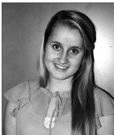
Ordførar Rikke

Første representasjon for Rikke vil vere den årlege førjulsappellen ved julegran-tenninga i Dale 1. søndag i advent!