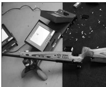
Mange skot går med.

Det kostar i prinsippet ikkje noko å delta. Dei som skyt med kaliber 22 må betale 20 kr for ammunisjon ved kvar trening. Alt utstyr som våpen osv. vert lånt ut gratis.