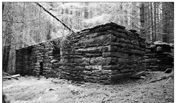
Gamle tufter på Østenstad.