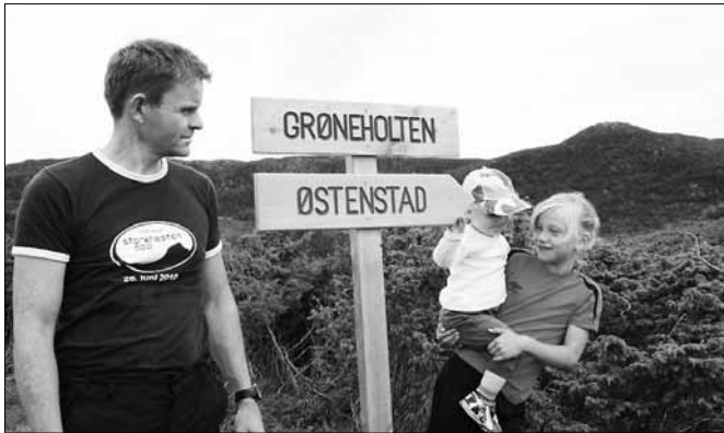
Familien på tur.