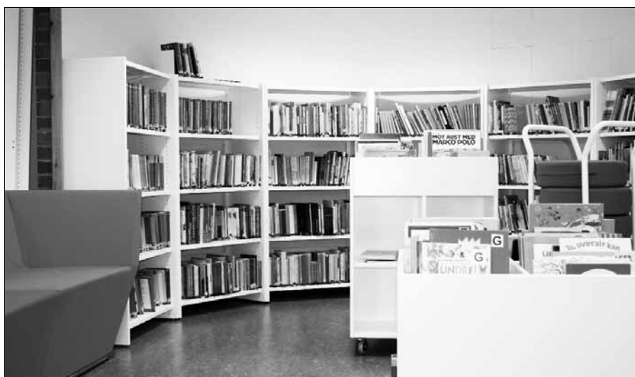
Den nye barnekroken.