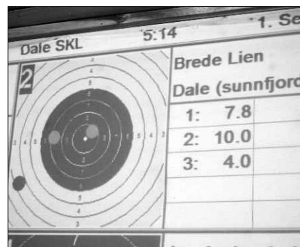
Vising på storskjerm.