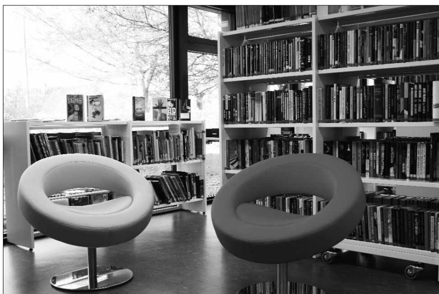
Stolane ventar berre på deg!