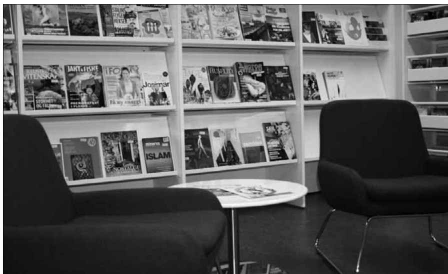
Mange kjekke tidsskrift å lese.