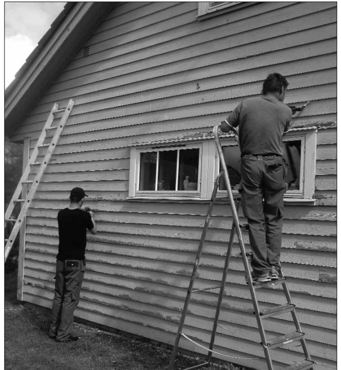
Sommar 2011 og arbeidsiver.

Du kan sjå innom butikken vår på Vevang i Dale eller vitje oss på nettsida www.vevangproduksjon.no for meir informasjon.