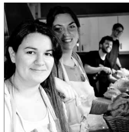
Alle volontørane hjalp til på den store hospiteringsdagen på Dale vgs.