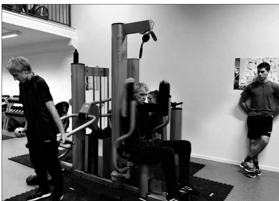
Stor aktivitet og tendensar til kø.