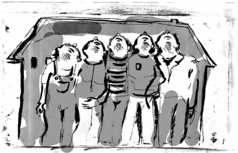
Illustrasjon til boka «Ordklode» av Eva Meier. Sjå side 11

Til slutt vil eg få ønskje alle fjalerbuarar ei triveleg førjulstid, ei riktig god jul og eit framgangsrikt nyttår!