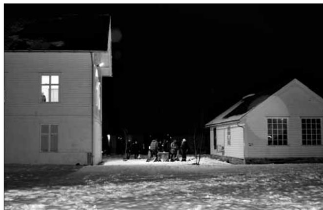
Mellom gamle kommunehuset og gamleskulen på Tusenårsstaden.

Fjaler sogelag vil ha ein viktig funksjon i registrering av kulturminne. Men vi ynskjer også å engasjera skulane i kommunen og einskildpersonar. Alle kan registrere kulturminne! Gå inn på kulturminnesøk for å sjå kva kulturminne som er registrert i vår kommune.