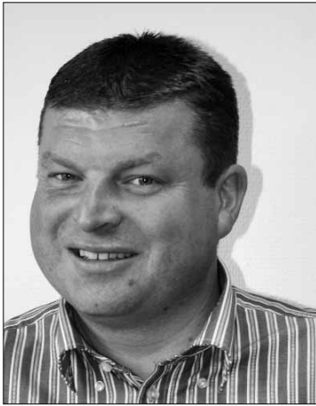
Ordførar ARVE HELLE