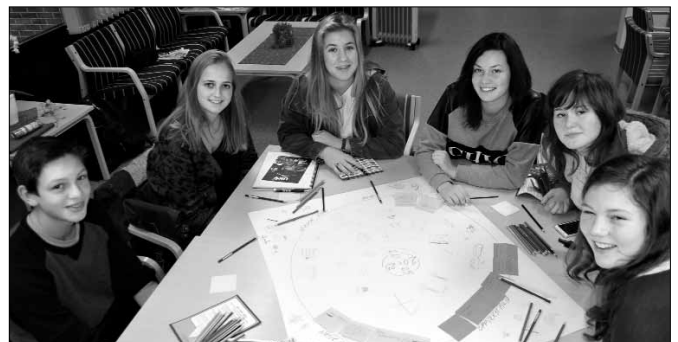
Ungdommens kommunestyre jobbar med samfunnsdelen av kommuneplanen.