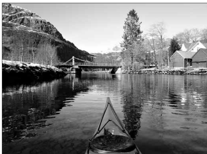
Storelva i Dale sett frå kajakken.